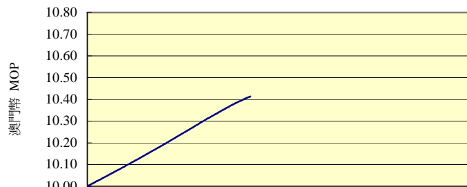
出資單位淨值變動 Evolução do Valor Líquido por Unidade de Participação